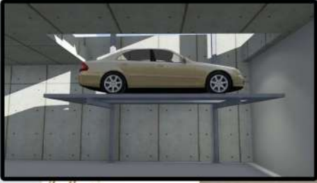
ARAÇ ASANSÖRÜ İLE OTOPARKA İNİŞ