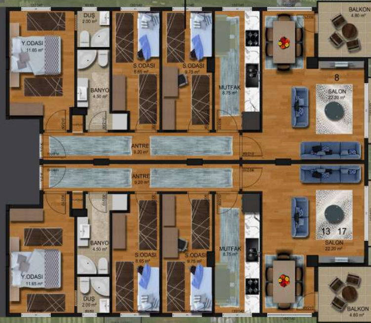
NORMAL KAT PLANI