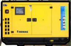
TÜM BİNAYA BİREBİR YETECEK JENERATÖR