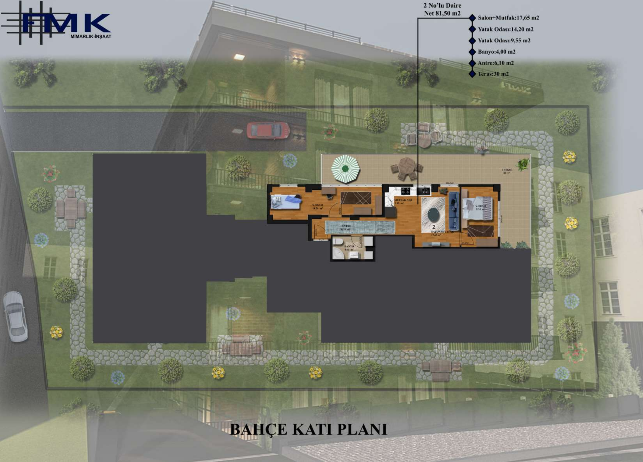
BAHÇE KATI PLANI