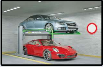
OTOPARKTA KATLI OTOPARK SİSTEMİ