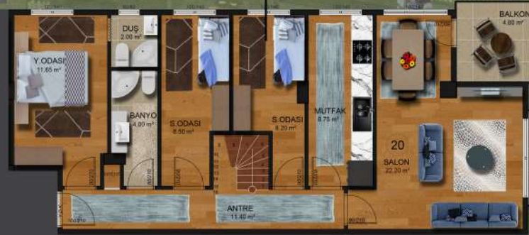
DUBLEKS ALT KAT PLANI